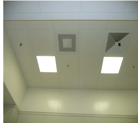
Ausführung: Raster 665x665 mm, Öffnung 625x625 mm mit 40 mm breiten Alu-Profilen, Kassetten Stahlblech, Oberflächen beschichtet, mit Einbauten