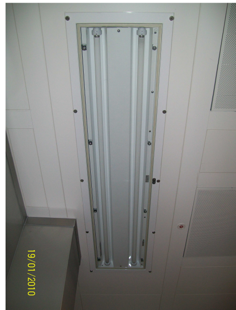
Ausführung: Ex-Einbauleuchte in Sonderkassette mit 100 mm breiten Alu-Profilen